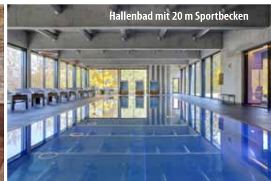
Hallenbad mit 20 m Sportbecken

Das 4-Sterne-Parkhotel CUP VITALIS begeistert seine Gäste mit seinem einladenden Ambiente, der traumhaften Aussicht auf Bad Kissingen, seinem SPA & Sportbereich sowie der 35.000 m 2 großen Parkanlage, die es umgibt.