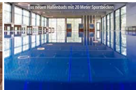
Das neuen Hallenbads mit 20 Meter Sportbecken

Das 4-Sterne-Parkhotel CUP VITALIS begeistert seine Gäste mit seinem einladenden Ambiente, der traumhaften Aussicht auf Bad Kissingen, seinem SPA & Sportbereich sowie der 35.000 qm großen Parkanlage, die es umgibt.