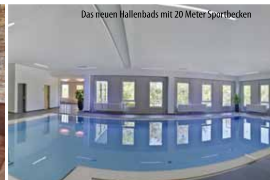
Das neuen Hallenbads mit 20 Meter Sportbecken

Das 4-Sterne-Parkhotel CUP VITALIS begeistert seine Gäste mit seinem einladenden Ambiente, der traumhaften Aussicht auf Bad Kissingen, seinem SPA & Sportbereich sowie der 35.000 qm großen Parkanlage, die es umgibt.