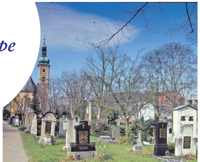
Auch der Kapellenfriedhof wird in die UNESCO-Bewerbung mit eingebracht.