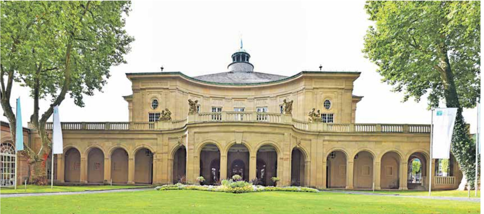
Der Regentenbau ist das historische Wahrzeichen der Stadt Bad Kissingen und selbstverständlich Teil des Property.

Für die „Great Spas of Europe“ hat die Stadt Bad Kissingen Zonen definiert, die sie in die Weltkulturerbe-Bewerbung einbringt. Das sind die Kernzone („Property“) und die Schutzzone („Bufferzone“) mit den wichtigsten Stadtelementen.