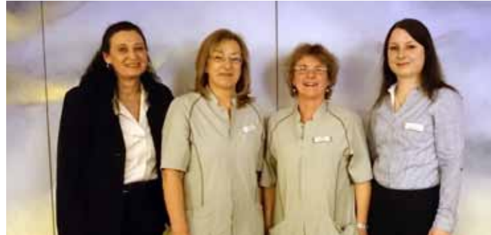
Unsere Damen vom Housekeeping