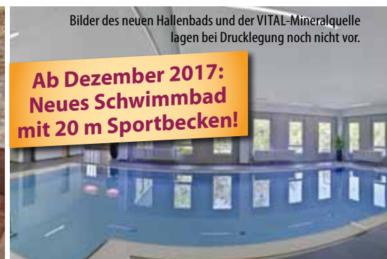
Bilder des neuen Hallenbads und der VITAL-Mineralquelle lagen bei Drucklegung noch nicht vor.

Ab Dezember 2017: Neues Schwimmbad mit 20 m Sportbecken!